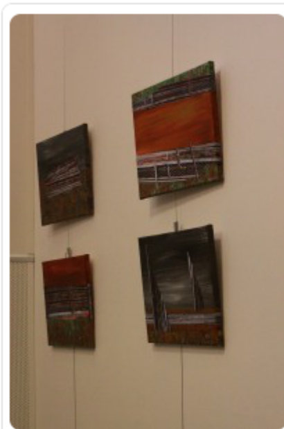
Kim Goldsmithin Reconstructions-sarjaa

Keskellä on erikoinen kuva lumpeesta: vesikasvi kukkii järven pohjassa.