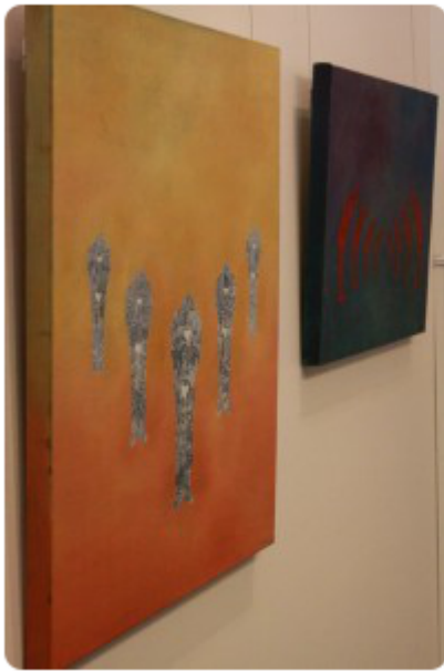
Ismo Jokiahon Kohteliaisuusmiehiä

- Kesä oli niin viileä ja sateinen, ettei lumme ilmeisesti ehtinyt kasvattaa kukalleen vartta. Eikä hämärä sadekesä suosinut myöskään luonnonvalossa kuvaamista, Mattila-Tolvanen nauraa.